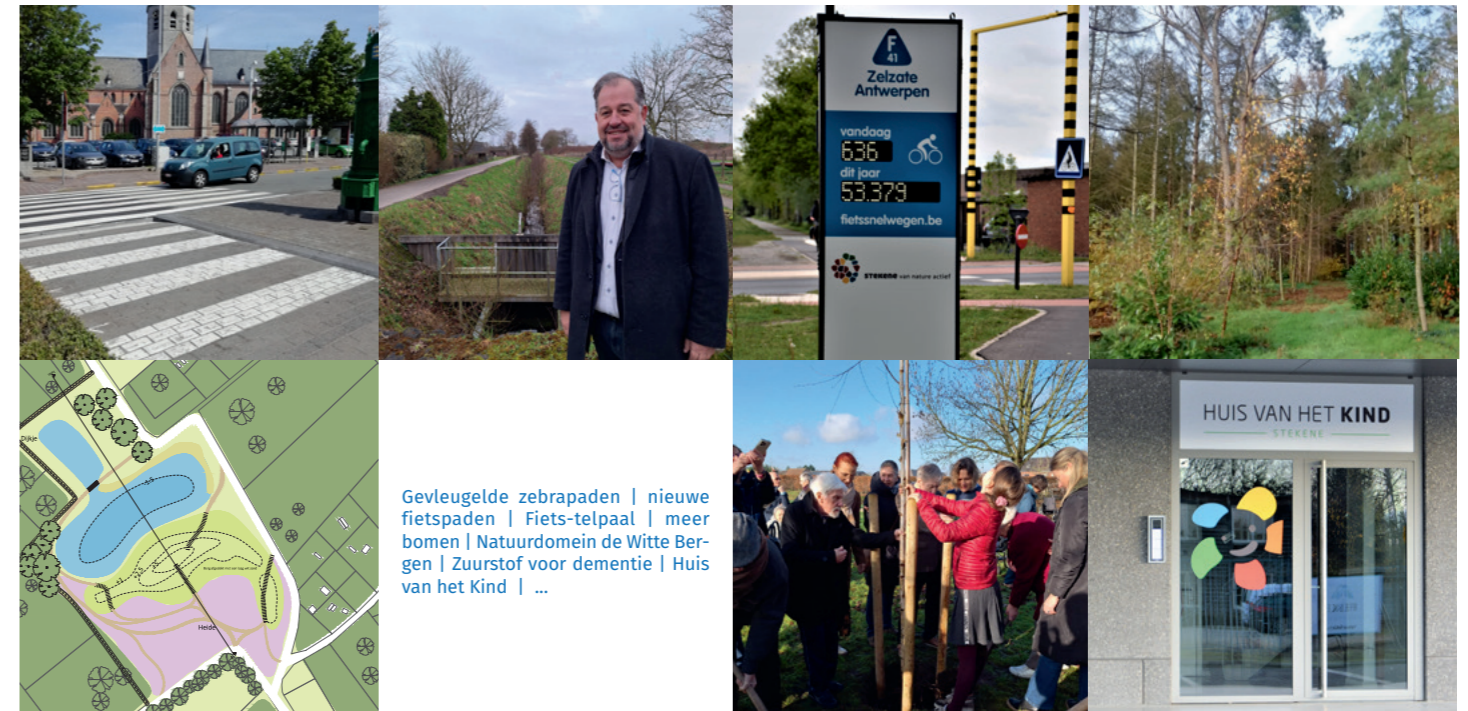
Gevleugelde zebrastraten | nieuwe fietspaden | Fiets-telpaal | meer bomen | Natuurdomein de Witte Berge | Zuurstof voor demencie | Huis van het Kind | ...

En dan is er natuurlijk nog Zorg Stekene , dat is uitgegroeid tot de sociale ontmoetingsplaats voor al onze inwoners, dat naast WZC Zoetenaard nog heel wat meer in zijn mars heeft: warme maaltijden aan huis, kortverblijf, thuiszorgdiensten, een mindermobielen centrale, een kinderdagverblijf, een dagcentrum, bejaarden- en andersvalidenwoningen in het Snoezelhof, enz.