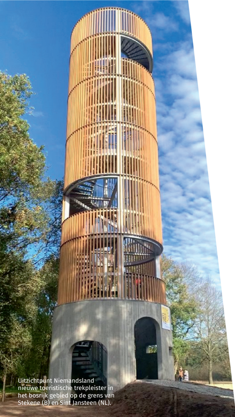
Uitzichtpunt Niemandsland nieuwe toeristische trekpleister in het bosrijk gebied op de grens van Stekene (B) en Sint Jansteen (NL).

Het park aan de Polenlaan willen we omvormen tot een centrumbos, dat moet aansluiten bij de herinrichting van de dorpskern, zodat je van het park over de zorgsite en de Markt naar onze centrumzone, en dan via de Nieuwstraat terug, een mooie, groene centrumwandeling kan maken.