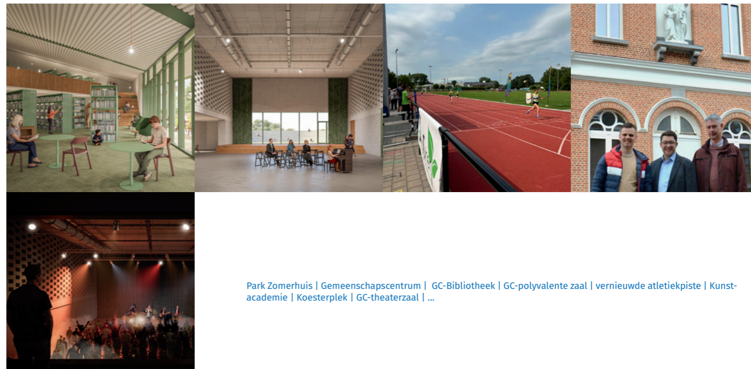
Park Zomerhuis | Gemeenschapscentrum | GC-Bibliotheek | GC-polyvalente zaal | vernieuwde atletiekpiste | Kunstacademie | Koesterplek | GC-theaterzaal | ...

Tot slot was er ook heel wat nostalgie te bespeuren bij de opening van de nieuwe kunstacademie eind augustus, in het vroegere klooster aan de Kerkstraat, dat van binnen een moderne kunstacademie geworden is, maar nog steeds de sfeer van vroeger uitademt.